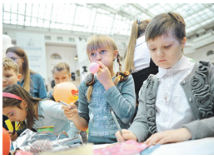
Через полчаса в Гостином Дворе вырос сказочный город-сад, разрешенный руками этих счастливых малышей