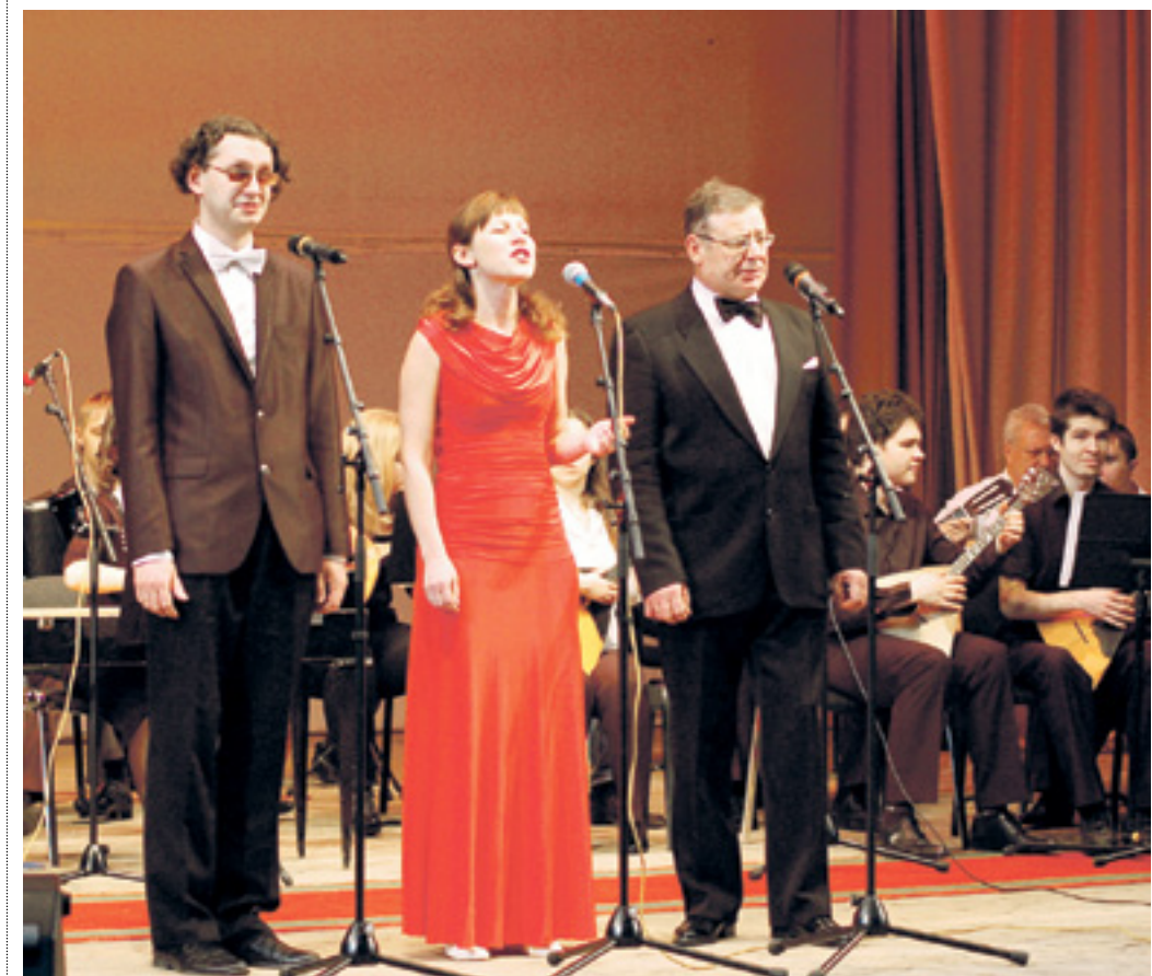
На сцене культурно-спортивного реабилитационного комплекса ВОС выступили многие самодельные коллективы, и в том числе солисты народного театра «Русская рапсодия»