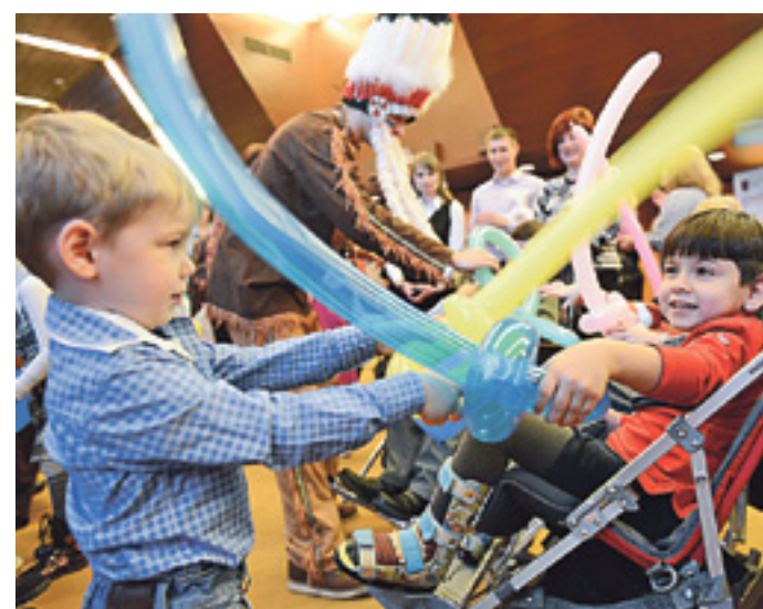
Юные гости в фойе выставки всерьез веселились и понарошку сражались

В рамках празднования XX фестиваля «Я люблю этот мир!» москвичи познкомились с экспонатами третьей ежегодной выставки «Добрых рук творение!», организованной префектурой и Управлением социальной защиты населения СВАО столицы. Здесь были представлены 300 работ от 120 авторов — людей с ограничениями по здоровью. ...В стеклянных вертикальных витринах, специально расставленных в этот день в Мраморном зале гостиницы «Космос», расположились на редкость яркие и жизнеутверждающие вещицы, сделанные талантливо и с душой. Забавные мягкие игрушки, улыбающиеся тек-