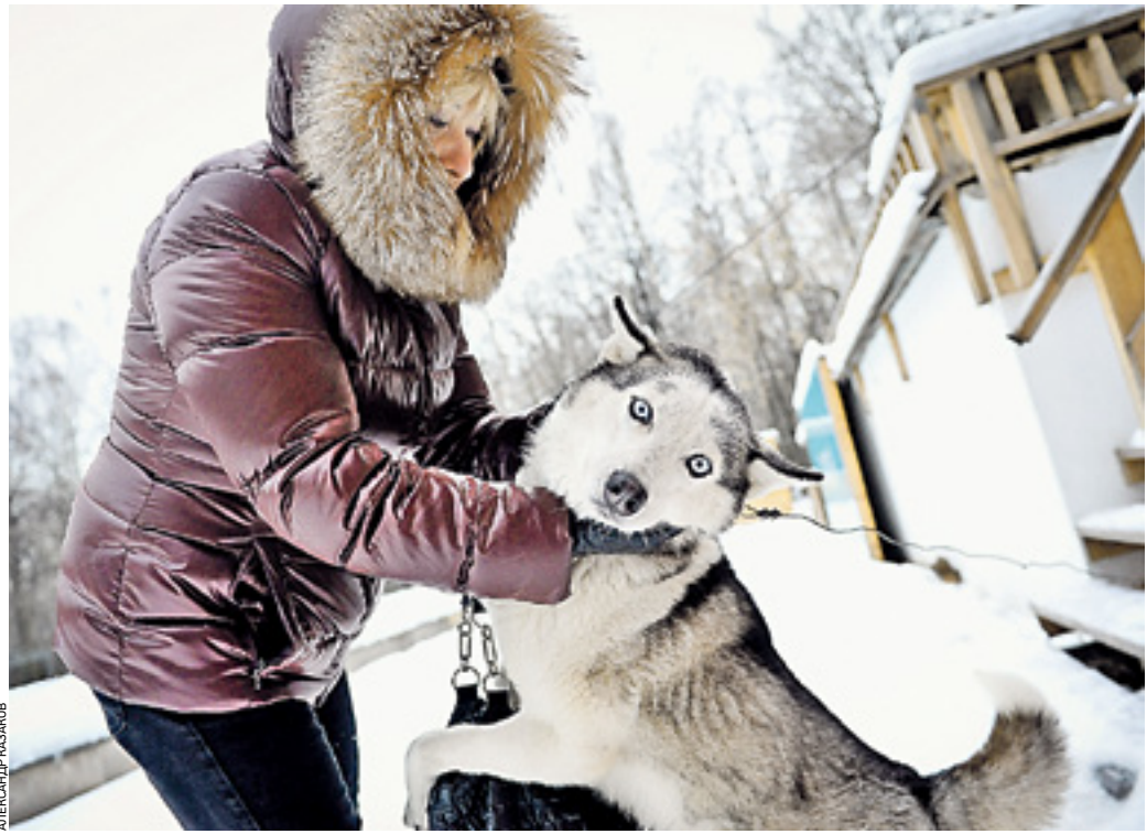
16 декабря 2013 года. Парк «Сокольники». Хаски по кличке Арчи радуется своим братьям старшим

ОБЩЕНИЕ С СОБАКАМИ — ОДИН ИЗ САМЫХ ЭФФЕКТИВНЫХ СПОСОБОВ ЛЕЧЕНИЯ ДЕТЕЙ С ОГРАНИЧЕНИЯМИ ПО ЗДОРОВЬЮ